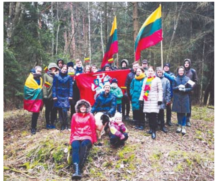
Kasmetinė tradicija – Vasario 16-osios žygis į Storių kalvas. Ten pakelti vėliavą keliauja ne tik dabartiniai J. Biliūno gimnazijos mokiniai, bet ir buvę gimnazistai.